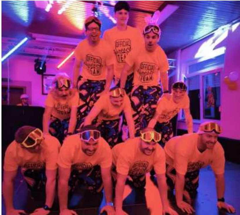
Lou Muchachos aus Louisendorf

Ein echtes Highlight waren außerdem die zwei Männerballette, die den Saal zum Beben brachten. Uns besuchten die Siegfried Bitches aus Materborn, die das Thema „Bauer sucht Frau“ vertanzt haben. Aber besonders stolz sind wir natürlich auf unsere eigenen Jungs: Die Lou Muchachos aus Louisendorf standen erstmals auf der Bühne. Extra für das Comeback unserer Stehung gegründet, lieferten sie einen Auftritt ab, der garantiert noch lange Gesprächsthema bleiben wird. Und wir hoffen das wir auch nächstes Jahr mit ihnen als Höhepunkt rechnen dürfen.