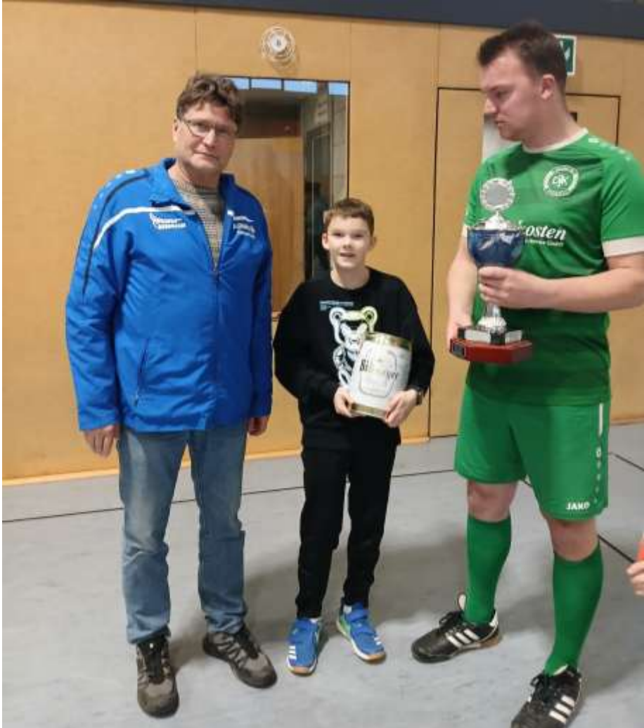
Fleißiger Helfer des Tim Minor Turnier