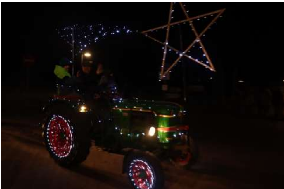
Viel Mühe hatten sich die Teilnehmer beim Schmücken der Fahrzeuge gegeben