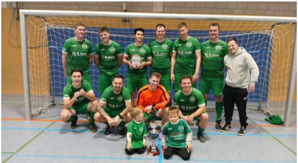
Siegermannschaft DJK Appeldorn II

Die DJK Appeldorn II hat sich bei der 28. Auflage des traditionsreichen Fußball-Turniers des C Ligisten SSV Louisendorf den Tim-Minor-Siegerpokal in der Dietmar-Müller-Sporthalle in Hau, an dem am Wochenende insgesamt fünf C-Ligisten teilnahmen, sichern können. Sie lösten damit den dreifachen Turniersieger der vergangenen Jahre SV Rindern ab. Acht Partien musste jede Mannschaft absolvieren, die jeweilige Spieldauer betrug 12 Minuten, somit kam jedes Team auf eine reine Nettospielzeit von 96 Minuten. Die Appeldorner, die im Modus "Jeder gegen jeden" mit Hin- und Rückspiel antraten, errangen in der Endabrechnung 16 Punkte mit fünf Siegen und einem Unentschieden und kassierten zwei Niederlagen. Mit 17 Treffern stellte die Reserve des Klubs aus Kalkar auch die torhungrigste Offensive des Turniers. Sie verwiesen damit in einem packenden Kopf-an-Kopf-Rennen den SV Rindern III, der am Ende 15 Zähler holte, auf den zweiten Platz. Den dritten Rang belegte SG Keeken-Schanz II mit elf Punkten. Dahinter folgte die Mannschaft des Ausrichters SSV Louisendorf, der großzügig seinen Gästen den Vortritt auf das Siegerpodest ließ und schließlich mit zehn Zählern Vierter wurde. Auf dem fünften Platz landete mit sechs Punkten die SV Bedburg-Hau II bei dieser schon traditionellen Veranstaltung zum Jahresbeginn.