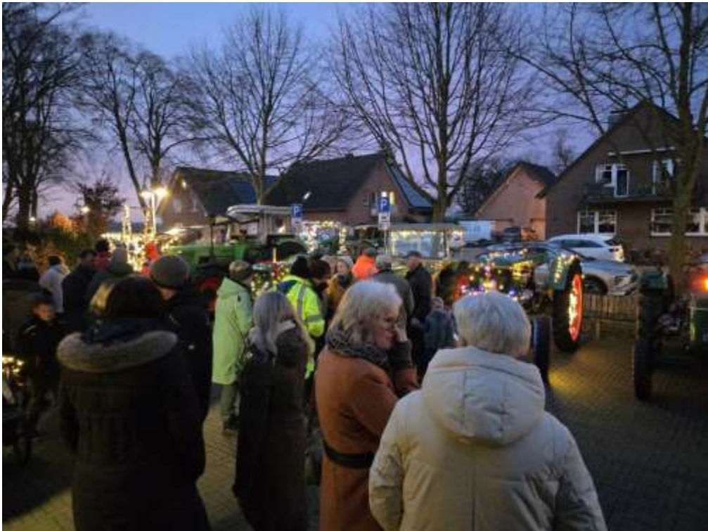
Viele Besucher bei der Lichterfahrt

Grund genug, auch schon die Planungen für die nächste Lichterfahrt aufzunehmen.