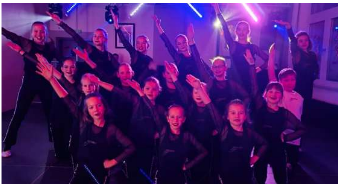
Gravenhoferperlen aus Altkalkar

Auch tänzerisch wurde einiges geboten. Gleich mehrere Tanzgruppen aus den Nachbardörfern zeigten ihr Können und sorgten für tosenden Applaus. Mit dabei waren die Gravenhoferperlen aus Altkalkar, Fidelüxx aus Materborn und die GroGaTi aus Till – allesamt mit starken Auftritten, tollen Kostümen und ordentlich Schwung.